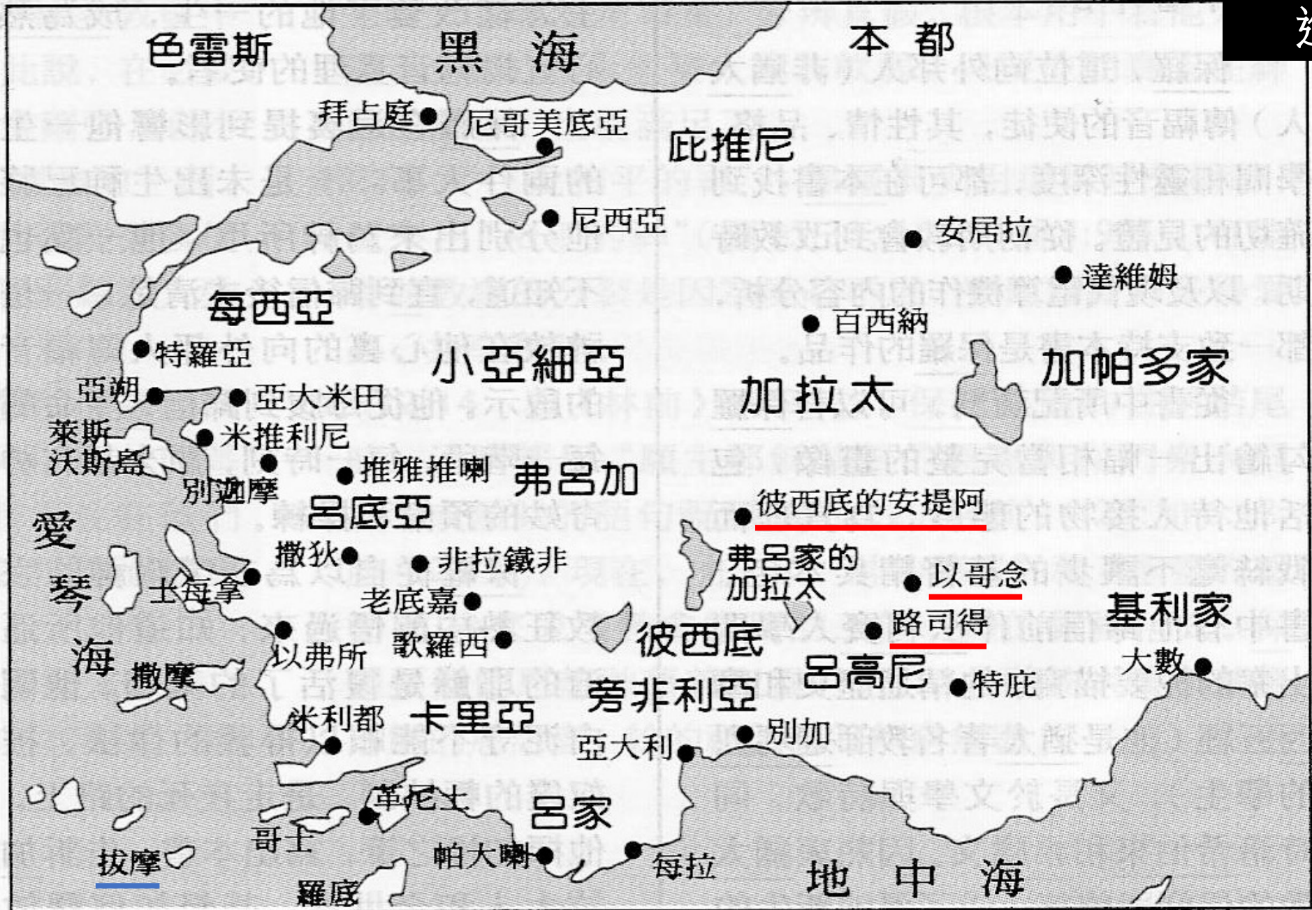
南加拉太地圖：保羅在此建立彼西底的安提阿，以哥念，特庇，路司得等教會。