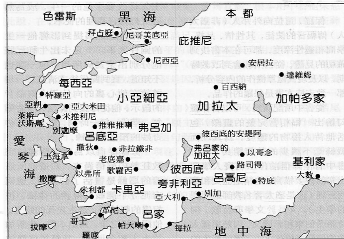
南加拉太地圖：保羅在此建立彼西底的安提阿，以哥念，特庇，路司得等教會。

但無論寫於何時何地，此書早已具有普遍而永存的價值，決不因時地難決而絲毫遜色，更無損於所載光芒萬丈的福音信息。